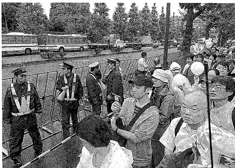
国会周辺で官邸前デモの警備をする警察官=20日、東京・永田町で

「再稼働」に抗議し、「脱原発」の声を届けようという金曜日恒例の官邸前デモ。自然発生的な個々人の集まりに、警視庁は「安全確保」として20日も国会周辺で厳重な警備を敷いた。参加者は「民意の表明がしにくい」「過剰規制によるデモつぶしでは」と疑問視している。デモと警備のあり方を考えた。(上田千秋、小坂井文彦)